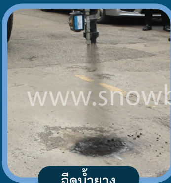
ฉีดน้ำยาง