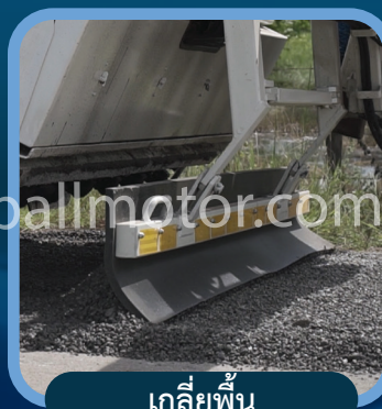
เกลี่ยพื้น