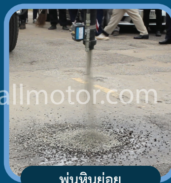
พ่นหินย่อย